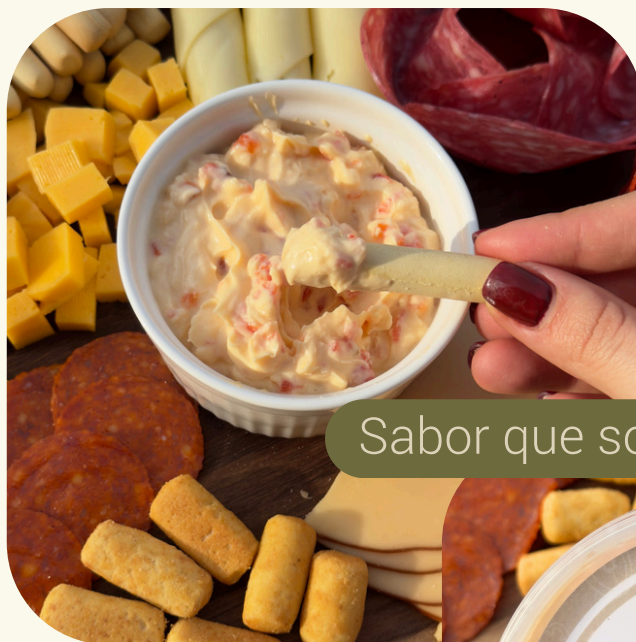
Sabor que sorprede